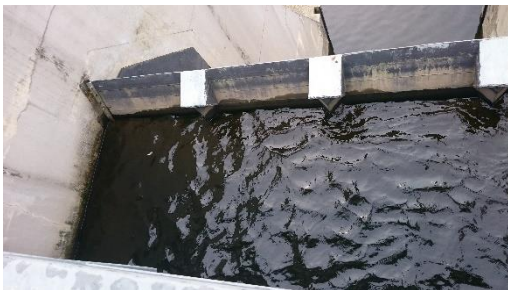
15.02.2018 Wehrklappe mit OLOID eisfrei