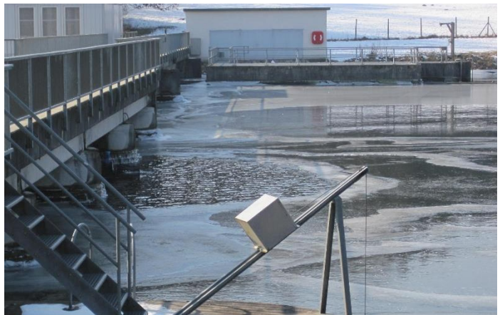
28.02.2018 Alle 4 Wehrklappen im Bild nur mit OLOID eisfrei