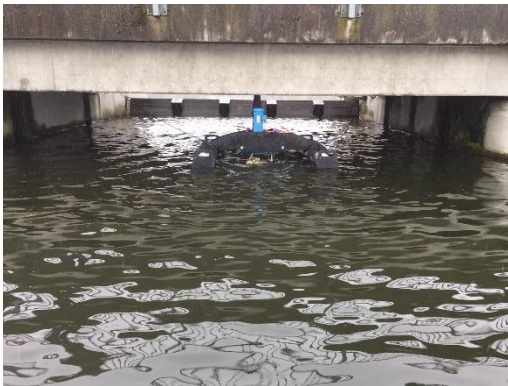
23.1.2018 OLOID Typ 400 mit Strömungsrichtung zur Wehrklappe