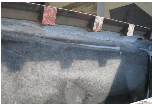
28.02.2018 Wehrklappe ohne OLOID zum Vergleich