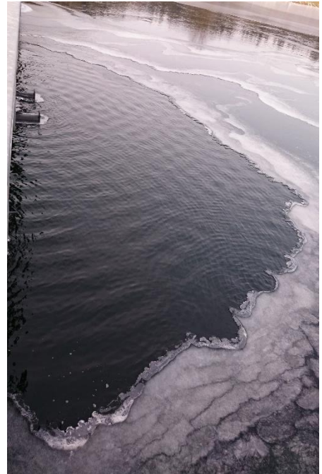
27.02.2018 ( -14^{\circ}\text{C} ) Eisfreihaltung auch hinter dem OLOID